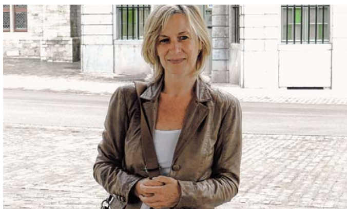
Ik wil nog zoveel boeken schrijven.